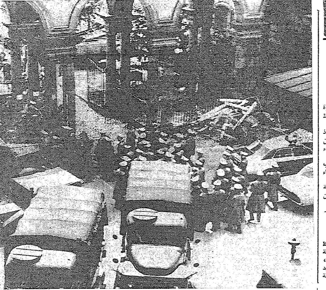
النوليس الاتاني يخلي جامعة جوهان وولفغانغ فون غوته...